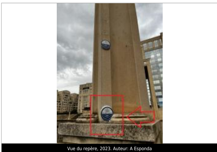
Vue du repère, 2023.

Code : CER_MTP_R_263_1 Date de mise à jour : 26/03/2025 Auteur : Cerema Méditerranée