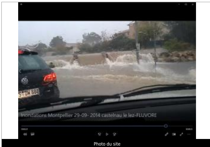
Inondations Montpellier 29-09-2014 castelnau le lez-FLUVORE