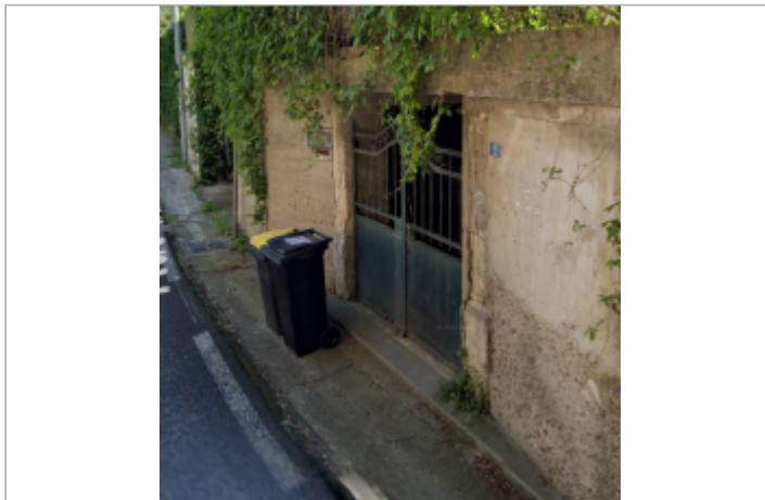
9 rue du prado castelnaud le lez