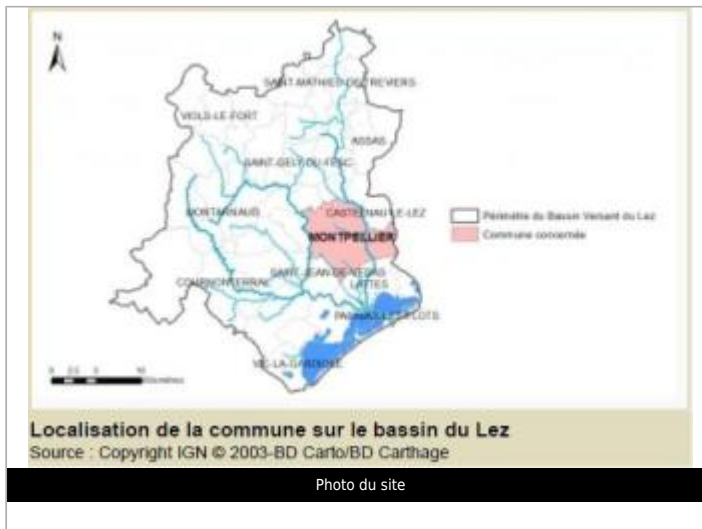
Localisation de la commune sur le bassin du Lez