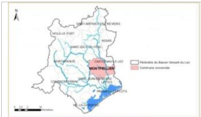
Localisation de la commune sur le bassin du Lez