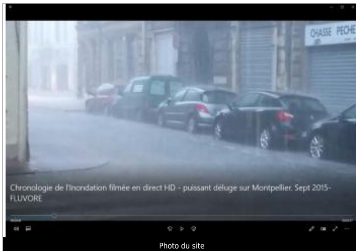
Chronologie de l'inondation filmée en direct HD - puissant déluge sur Montpellier, Sept 2015- FLUVORE