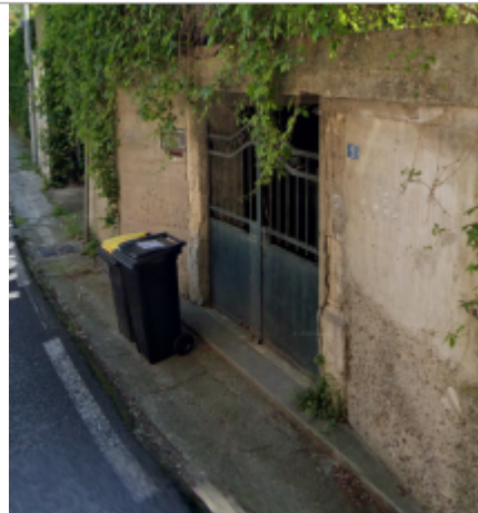
9 rue du prado castelnau le lez

Coordonnées WGS84 : X: 3.89480563 / Y: 43.62960710