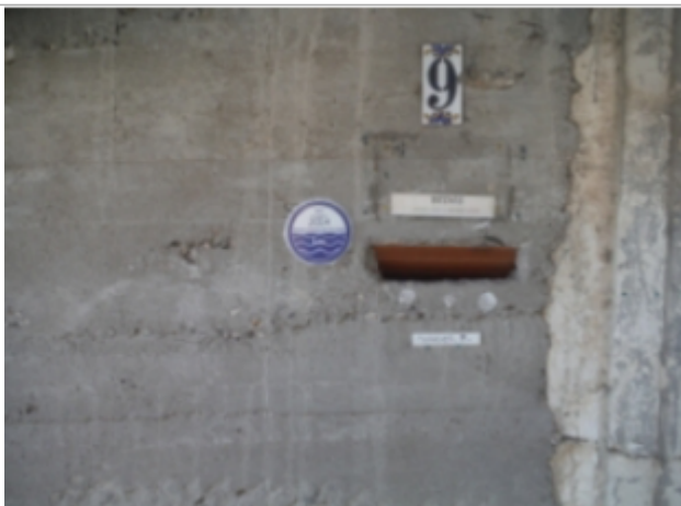
macaron 9 rue du prado castelnau le lez

Altitude calculée de l'eau (en m) : 21.51