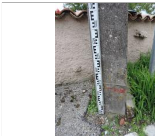
Marque sur le pied du poteau électrique

Altitude calculée de l'eau (en m) : 208.87