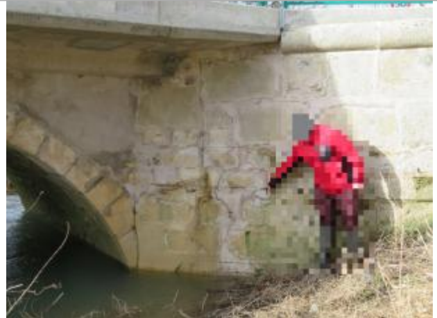
Amont du pont en rive droite