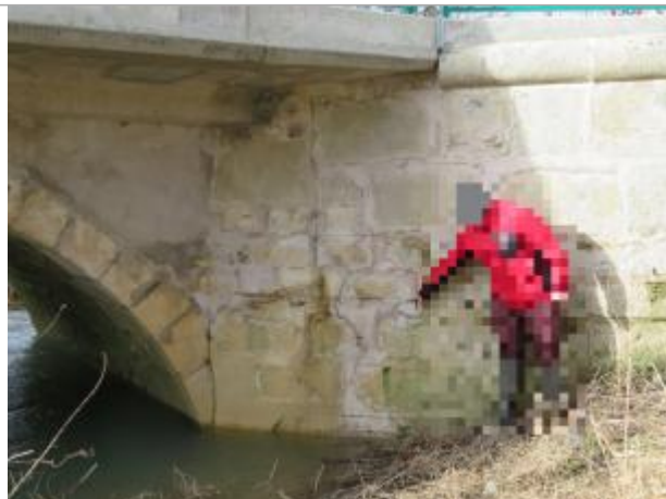
Amont du pont en rive droite