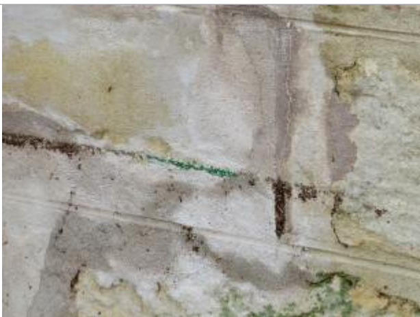
Marque sur le mur en L, sur la culée en amont rive droite

Altitude calculée de l'eau (en m) : 208.46 m