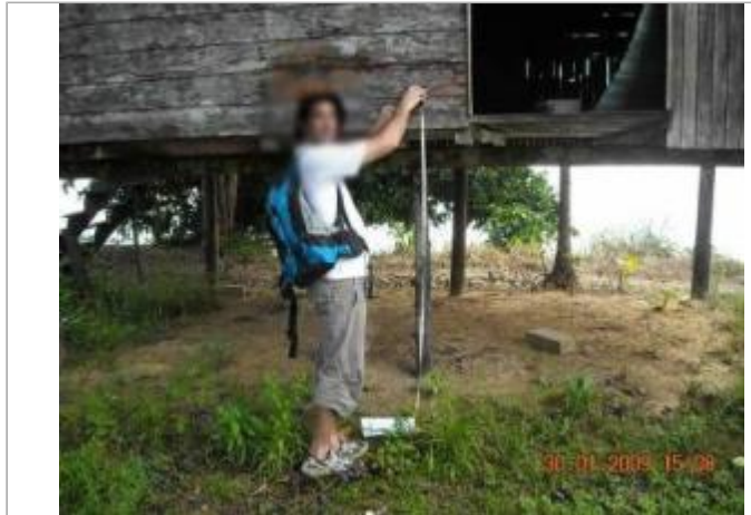
Pont en amont rive droite