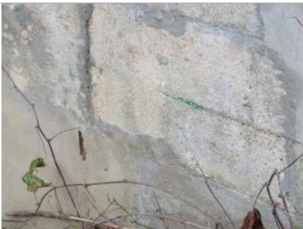
Marque sur le mur en L de la culée du pont, amont rive droite

Altitude calculée de l'eau (en m) : 197.75