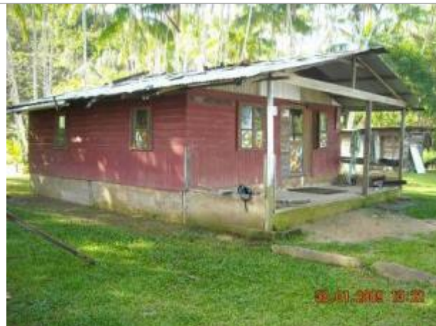
Rue descendant à la rivière près de la réserve incendie