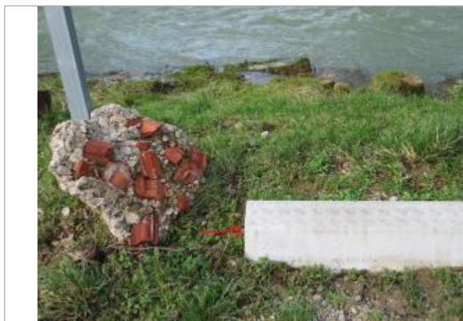
Coin haut gauche de la margelle du point d'aspiration

Maximum de l'inondation : Oui Visibilité : Oui État du repère : Disparu Pérennité : Moyenne