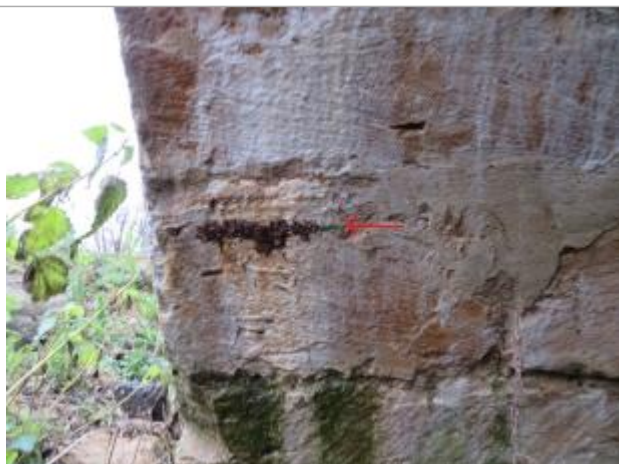
Marque sur la culée de la 1ère arche du pont, peinte à l'intérieur de la voûte, aval RD

Altitude calculée de l'eau (en m) : 178.03 m