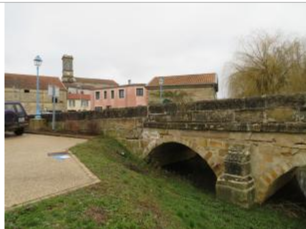
Aval du pont, RD