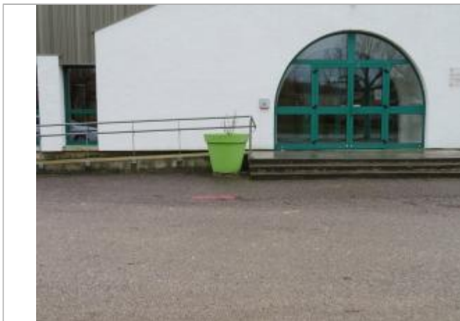
Marque au sol devant la salle des fêtes, face aux marches

Altitude calculée de l'eau (en m) : 178.13 m