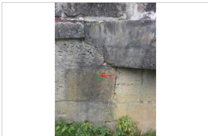
Marque sur le pont

Altitude calculée de l'eau (en m) : 152.18