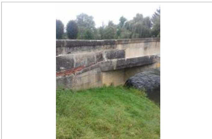
Amont du pont en rive gauche