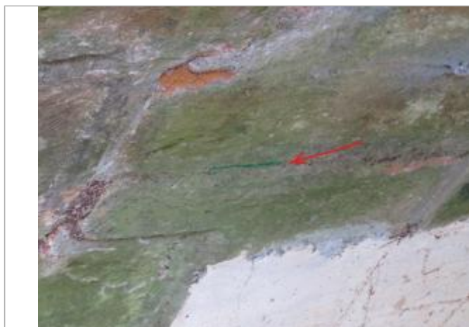
Marque située sur la 2ème arche e partant de la rive droite, aval du pont

Altitude calculée de l'eau (en m) : 152.28 m