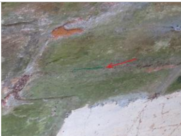
Marque située sur la 2ème arche et partant de la rive droite, aval du pont

Altitude calculée de l'eau (en m) : 152.28 m