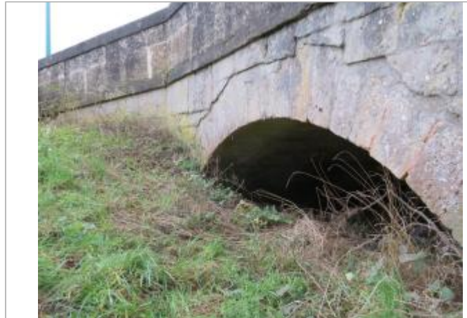
Aval du pont de la rue du Pont