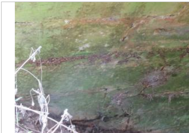
Marque située sur la 1ère arche du pont en partant de la rive droite

Altitude calculée de l'eau (en m) : 152 m