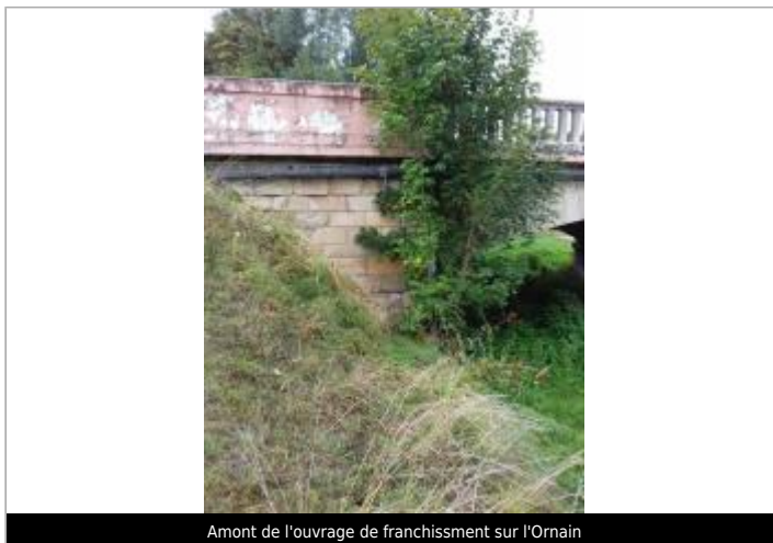
Amont de l'ouvrage de franchissement sur l'Ornain