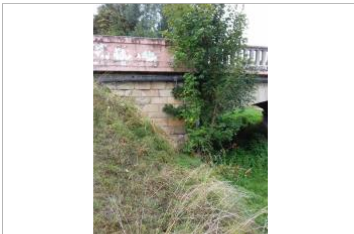
Amont de l'ouvrage de franchissement sur l'Ornain