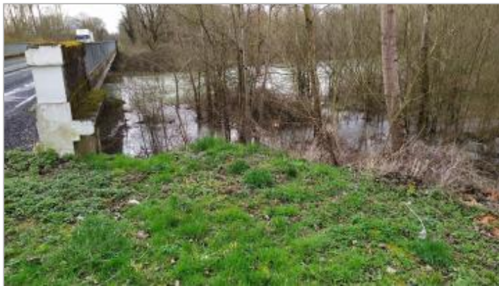
Aval de l'ouvrage de franchissement de l'Ornain