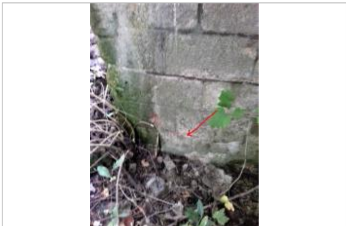
Marque à l'aval du pont rive droite