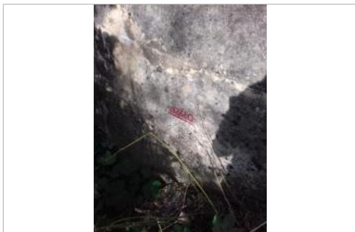
Marque rouge à l'aval du pont en rive gauche

Altitude calculée de l'eau (en m) : 128.3