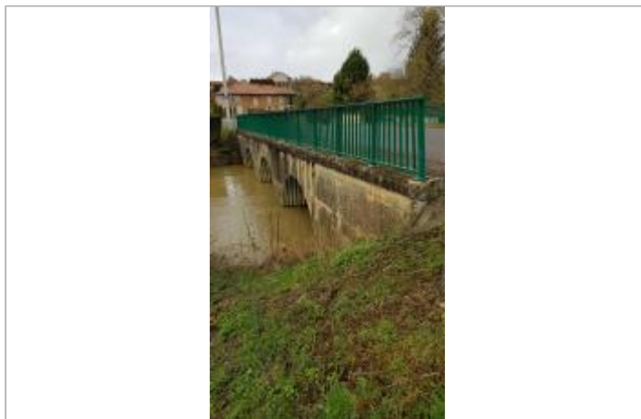
Côté aval du pont sur la Chée sur la RD62