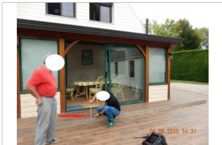
Laisse de crue 5 cm au dessus de la margelle située devant la baie vitrée de la véranda et à 17cm/terrasse

NIVELLEMENT SPC SACN. LE SPC N'EST PAS GÉOMÈTRE EXPERT, LES COTES SONT DONNÉES À TITRES INDICATIF. - 30/09/2021