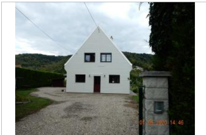
3247 Le Conihout

Coordonnées WGS84 : X: 0.83712152 / Y: 49.39479400