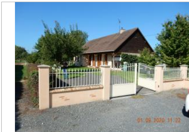
65 Quai Emile Dehays

Coordonnées WGS84 : X: 0.80945616 / Y: 49.46899500