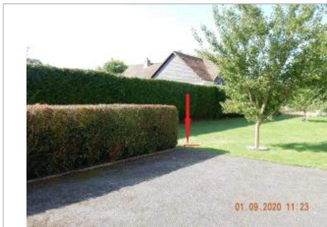
Laisse de crue sur une bordure en ciment, à 10 cm/sol, située dans la cours devant la maison.

NIVELLEMENT SPC SACN. LE SPC N'EST PAS GÉOMÈTRE EXPERT, LES COTES SONT DONNÉES À TITRES INDICATIF. - 30/09/2021