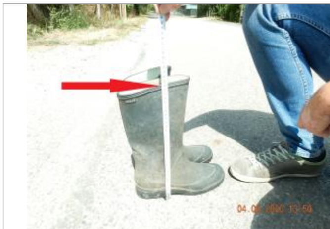
Laisse de crue au niveau du sommet des bottes