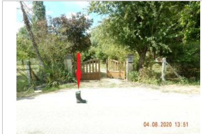
Route des Marais, devant le 2115.

Coordonnées WGS84 : X: 0.87264150 / Y: 49.41703900