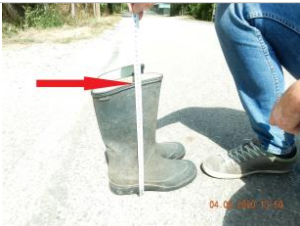
Laisse de crue au niveau du sommet des bottes

NIVELLEMENT SPC SACN. LE SPC N'EST PAS GÉOMÈTRE EXPERT, LES COTES SONT DONNÉES À TITRES INDICATIF. - 15/05/2021