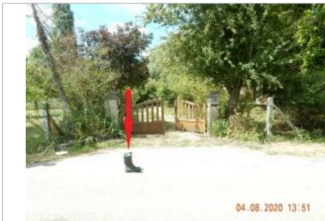
Route des Marais, devant le 2115.