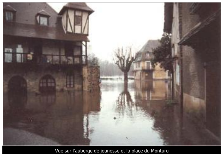
Vue sur l'auberge de jeunesse et la place du Monturu