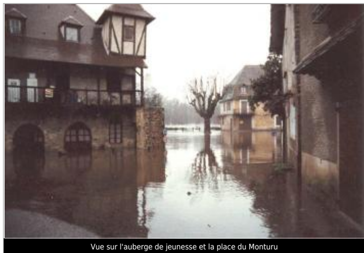
Vue sur l'auberge de jeunesse et la place du Monturu