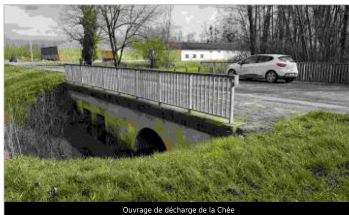
Ouvrage de décharge de la Chée