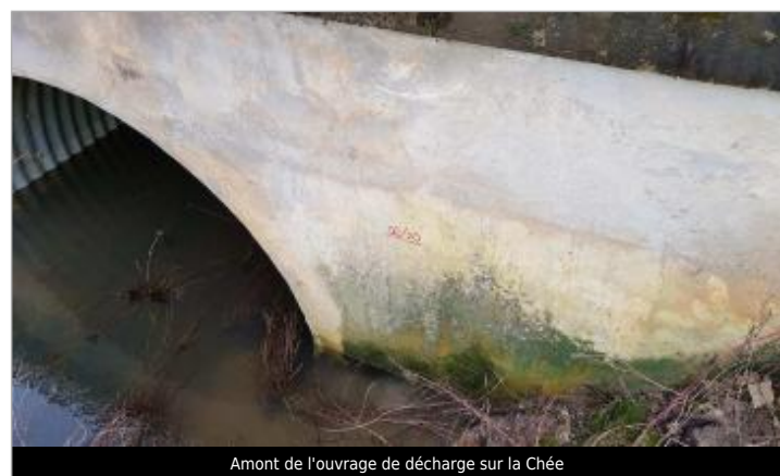
Amont de l'ouvrage de décharge sur la Chée