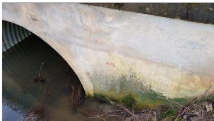
Amont de l'ouvrage de décharge sur la Chée