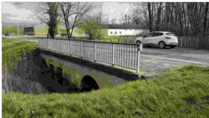
Ouvrage de décharge de la Chée