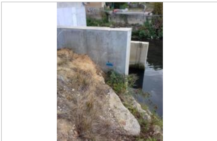
Marque sur le mur de la maison, aval RD de l'usine

Altitude calculée de l'eau (en m) : 134.62 m