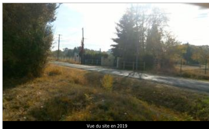
Vue du site en 2019