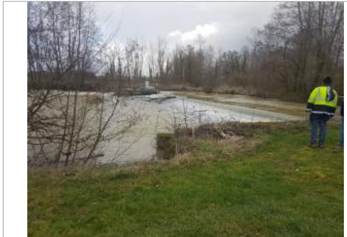
Seuil sur la Saulx, aval RG

Coordonnées WGS84 : X: 4.95547780 / Y: 48.79372900