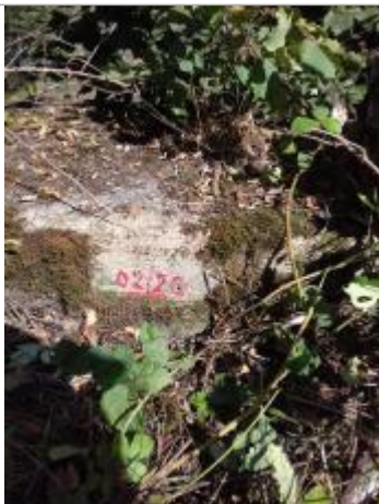
Marque sur la dernière pierre du couronnement, côté pré, aval RG du seuil

Altitude calculée de l'eau (en m) : 135.23 m