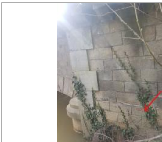
Marque rouge sur la culée amont du pont en rive droite

Altitude calculée de l'eau (en m) : 126.97