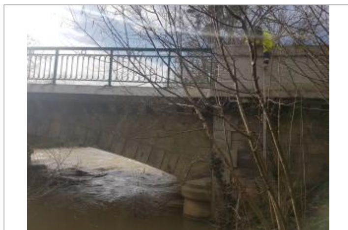
Pont sur la Saulx sur la Route d'Alliancelles, amont RD

GÉOLOCALISATION Coordonnées WGS84 : X: 4.90591043 / Y: 48.78776750 Coordonnées RGF93 (Lambert 93) X: 840014.92 / Y: 6855876.54 Coordonnées RGF93 (ETRS89) : X: 4.9059104 / Y: 48.7877675 Code Hydro: F5--0200 Rive de référence: Droite