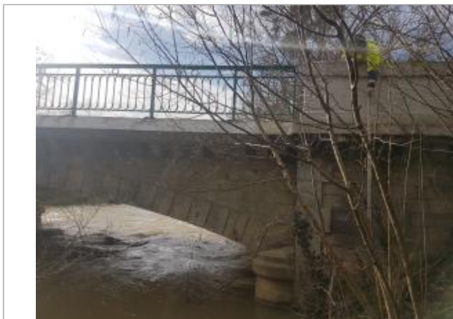
Pont sur la Saulx sur la Route d'Alliancelles, amont RD