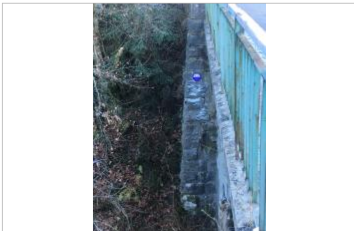
repère du pont des Lanternes

Maximum de l'inondation : Oui Visibilité : Oui État du repère : Bon Pérennité : Longue PHEC : Oui