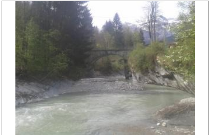
Pont des Lanternes