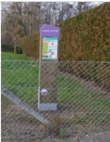
Macaron à 41 cm/sol.

NIVELLEMENT SPC SACN. LE SPC N'EST PAS GÉOMÈTRE EXPERT, LES COTES SONT DONNÉES À TITRE INDICATIF. - 21/09/2022