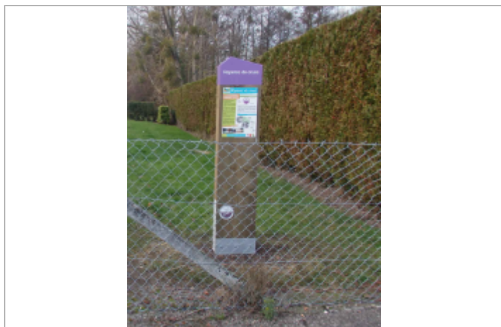
Macaron à 41 cm/sol.

NIVELLEMENT SPC SACN. LE SPC N'EST PAS GÉOMÈTRE EXPERT, LES COTES SONT DONNÉES À TITRE INDICATIF. - 21/09/2022