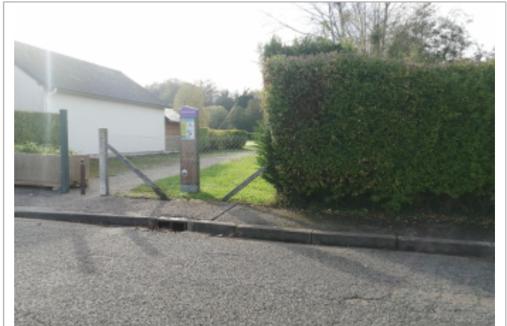
Rue Emile Bourdon, à proximité du terrain de jeux

Coordonnées WGS84 : X: 1.05333800 / Y: 49.90466100