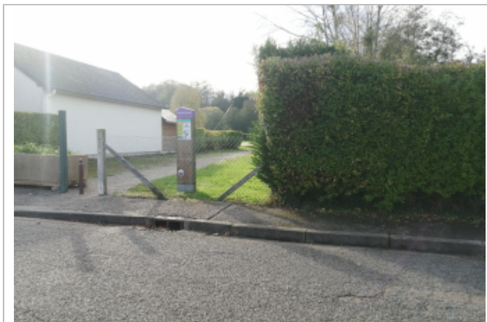
Rue Emile Bourdon, à proximité du terrain de jeux

Coordonnées WGS84 : X: 1.05333800 / Y: 49.90466100