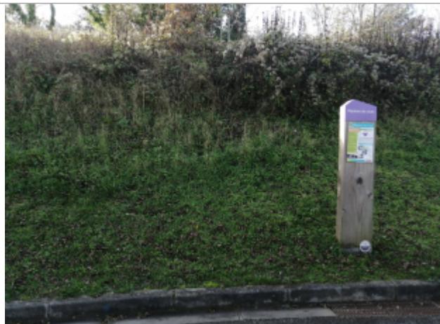
Rue des Tisserands