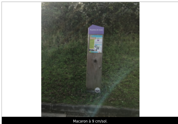
Macaron à 9 cm/sol.

NIVELLEMENT SPC SACN. LE SPC N'EST PAS GÉOMÈTRE EXPERT, LES COTES SONT DONNÉES À TITRE INDICATIF. - 21/09/2022