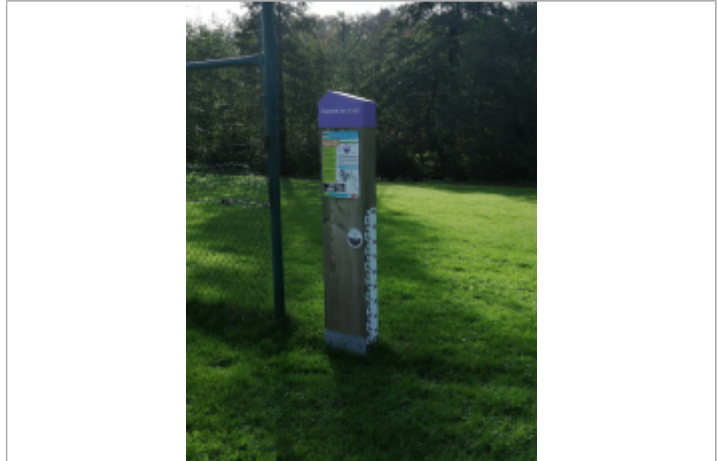
Le totem du repère de crue d'Anneville-sur-Scie

MARQUE Maximum de l'inondation : Oui Visibilité : Oui État du repère : Bon Pérennité : Longue