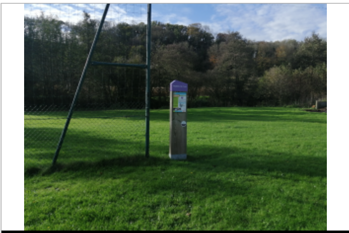
Derrière le stade d'Anneville-sur-Scie

GÉOLOCALISATION Coordonnées WGS84 : X: 1.08540100 / Y: 49.82701100 Coordonnées RGF93 (Lambert 93) : X: 562149.85 / Y: 6971469.03 Coordonnées RGF93 (ETRS89) : X: 1.085401 / Y: 49.827011 Code Hydro: G3100600 Rive de référence: