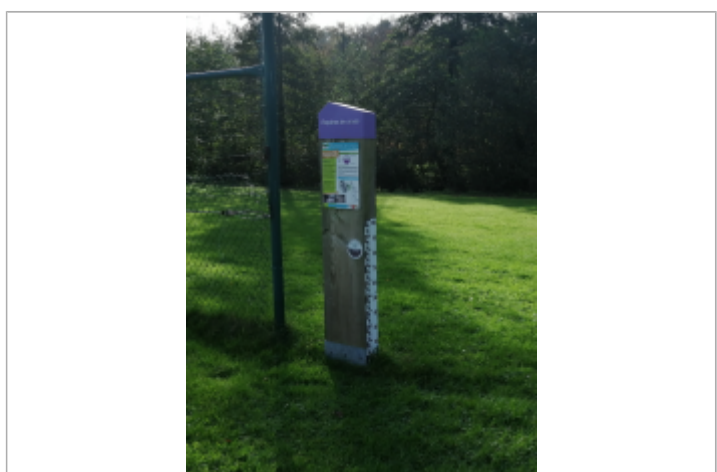
Le totem du repère de crue d'Anneville-sur-Scie

MARQUE Maximum de l'inondation : Oui Visibilité : Oui État du repère : Bon Pérennité : Longue