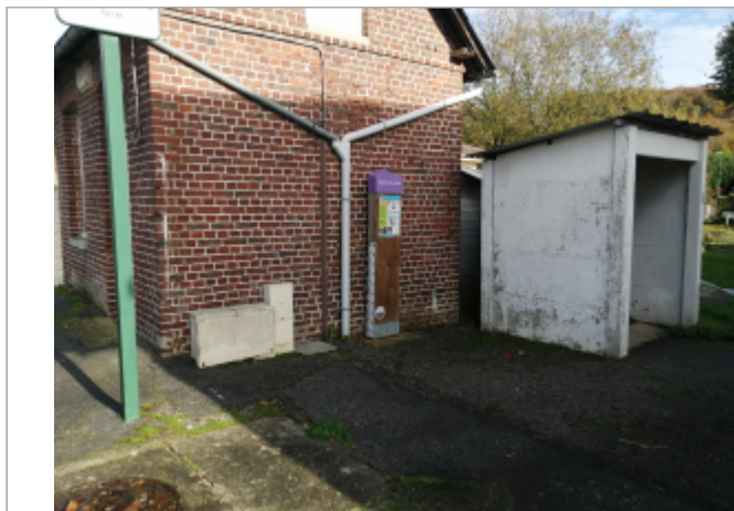
Entre l'arrêt de bus de l'Eglise et l'abris blanc