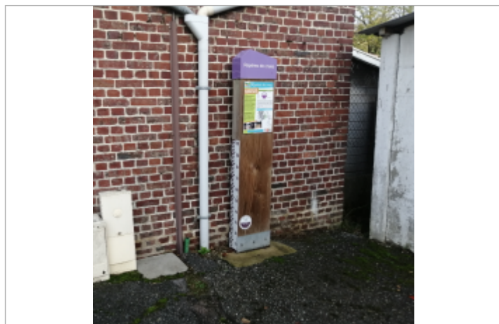
Le totem du repère de crue de la route du cidre de Crosville-sur-Scie