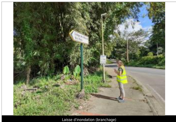
Laisse d'inondation (branchage)

Maximum de l'inondation : Non Visibilité : Oui État du repère : Disparu Pérennité : Aucune