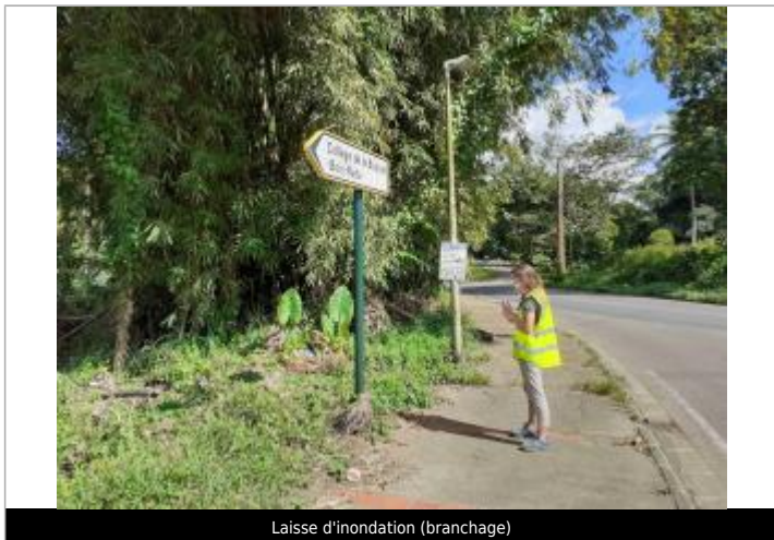
Laisse d'inondation (branchage)

Maximum de l'inondation : Non Visibilité : Oui État du repère : Disparu Pérennité : Aucune