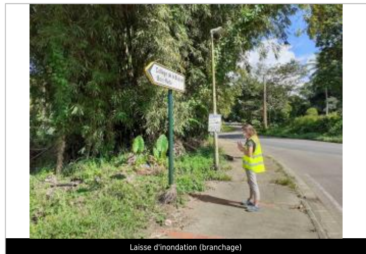
Laisse d'inondation (branchage)