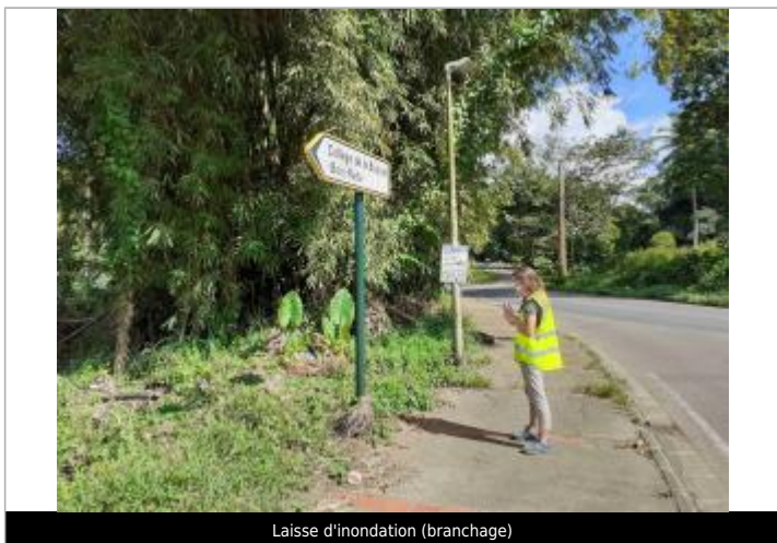
Laisse d'inondation (branchage)

Maximum de l'inondation : Non Visibilité : Oui État du repère : Disparu Pérennité : Aucune