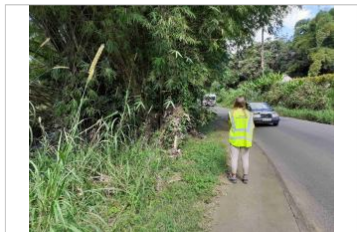
Laisse d'inondation (branche) accrochée aux arbres