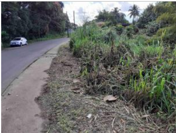
Aplatissage de la végétation