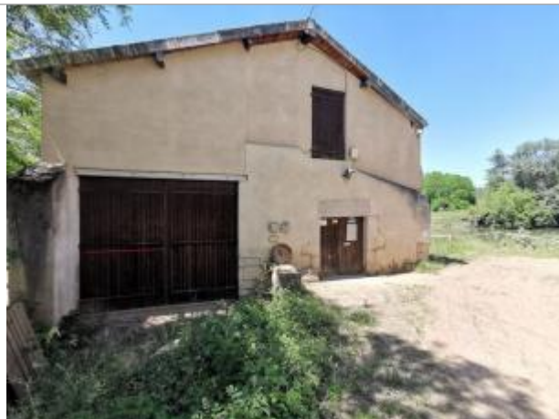
Porte bâtiment