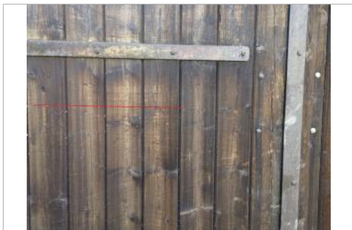
Marque sur la porte

Altitude calculée de l'eau (en m) : 160.99 m