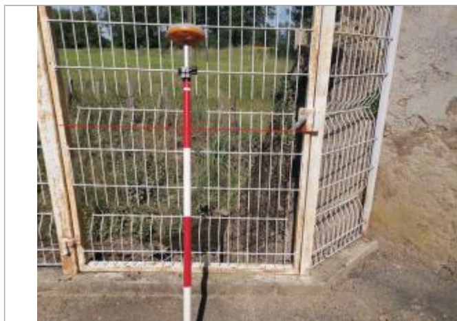
Portail blanc

Altitude calculée de l'eau (en m) : 193.82 m