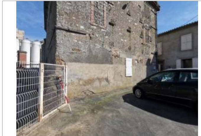
Portail blanc - Photo © AGERIN

Coordonnées WGS84 : X: 2.19359898 / Y: 43.76176726