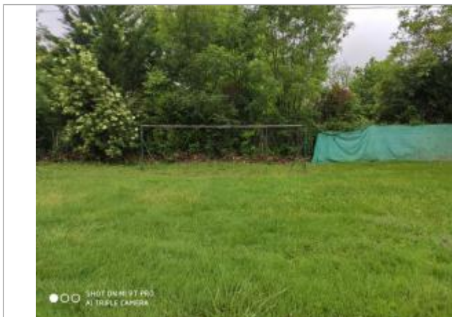
Haie - Photo © AGERIN

Coordonnées WGS84 : X: 2.16183857 / Y: 43.77081917