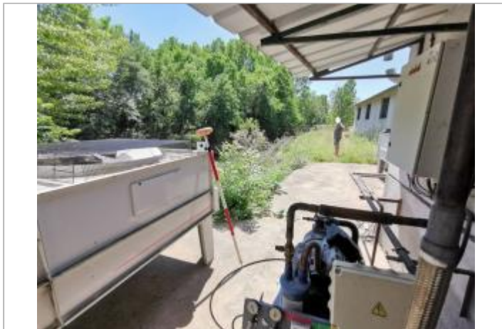
Machine industrielle - Photo © AGERIN