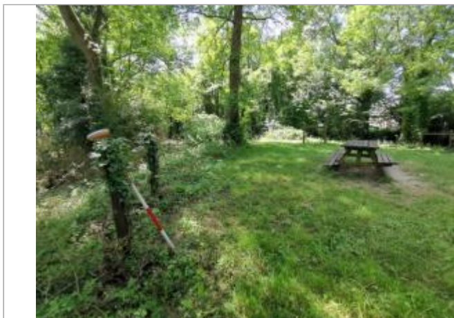
Poteau en bois