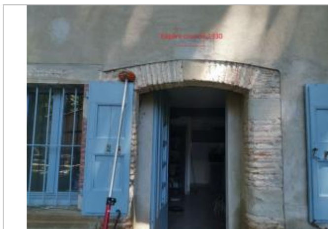
Habitation du moulin