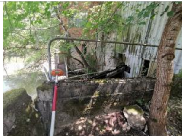
Muret en parpaing

Coordonnées WGS84 : X: 1.93305088 / Y: 43.76154853