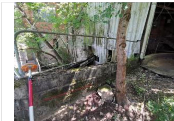
Trace sur le muret - Photo © AGERIN

Altitude calculée de l'eau (en m) : 132.15 m