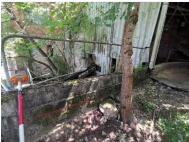
Trace sur le muret - Photo © AGERIN

Altitude calculée de l'eau (en m) : 132.15 m