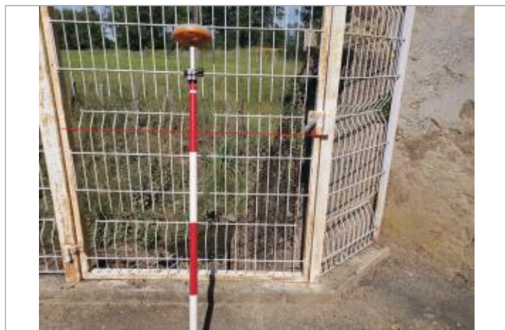
Portail blanc

Altitude calculée de l'eau (en m) : 193.82