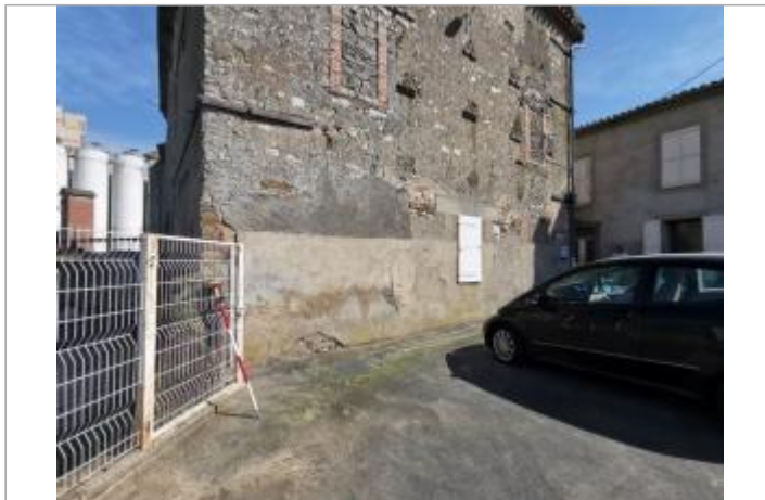
Portail blanc