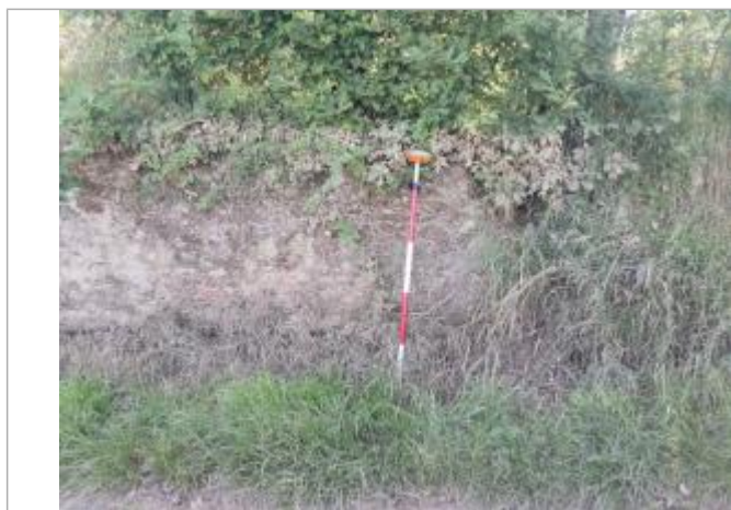
Trace de boue sur vegetation - Photo © AGERIN

Altitude calculée de l'eau (en m) : 195.63